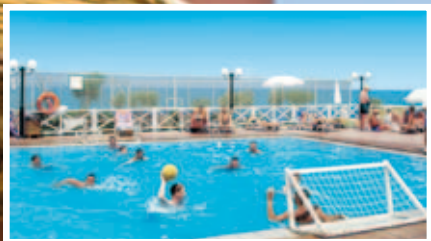
excel in water polo

i think that this is the room of my dreams