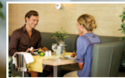
Mediterranean flavours at Olive tree

Besuchen Sie unser a la carte Olive Tree Mittelmeer-Restaurant, ein im Schatten gelegenes und bezauberndes Restaurant, das kulinarische Gerichte und traditionelle Spezialitäten aus Kreta anbietet. Genießen Sie ihr Abendessen in entspannter Atmosphäre und kosten Sie unsere vorzügliche Mittelmeerspezialitäten.