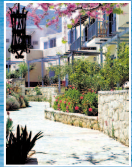
a true sense of serenity