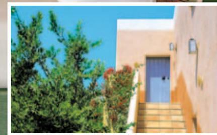
wake up to real beauty

Wir heißen Sie in die verführerische Welt der romantischen und kinderfreien Ferien willkommen. Unser Resort ist sowohl für Paare, für Singles und für Teenager geeignet. Sonnenunter-Egangerlebnis: Genießen Sie unseren perfekten Sonnenuntergang, Ihren Champagner und spazieren Sie Hand in Hand an unserem herrlichen Strand. Wir werden unser Bestes geben, Ihre Wünsche zu erfüllen.