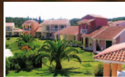
amazing gardens surrounding you

i will let my children discover true adventure