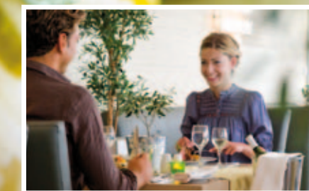
discover true culinary treasures at Olive Tree

Olive Tree a la carte Mittelmeer-Restaurant! Begeben sie sich auf eine kulinarische Reise in die Welt der raffinierten Mittelmeer-Kochkunst.